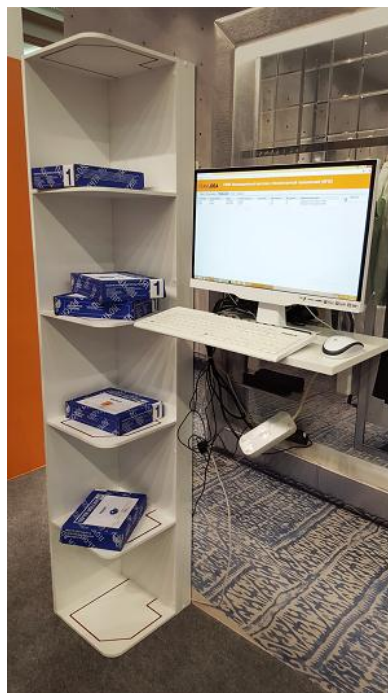
Умная полка / витрина RFID